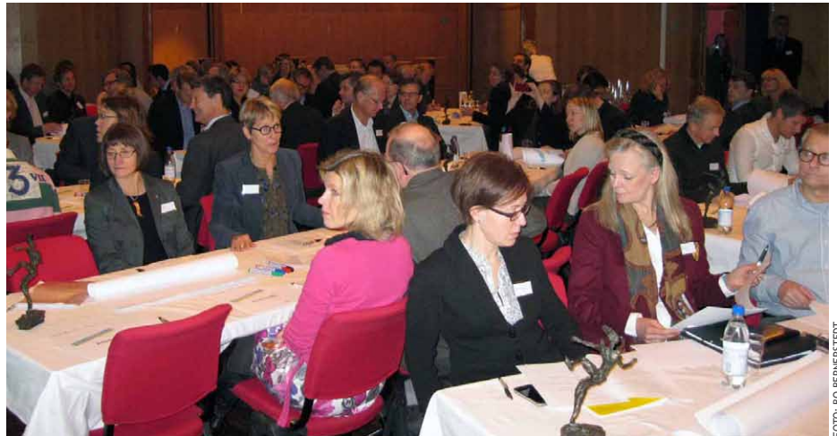
Det pågick diskussioner och grupparbeten under hela dagen.

Innovationsmotorn i Sörmland har bildats för att mäta behovet av hjälp i mycket tidiga skeden. Både företag och individer har möjlighet att ta del av innovationsmotorn. Sörmland är bra på att identifiera problem och söka lösningar för innovationer som kommit fram i forskningsfattiga miljöer. Innovationsmotorn i Sörmland har som främsta uppdrag att satsa på personer med bra idéer. Det är människorna