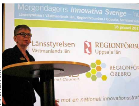
Sörmland, Västmanland, Uppsala och Örebro län presenterade sina innovativa miljöer.